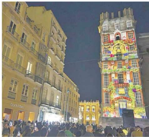
El ideal del kitsch es un valor igual a cero.