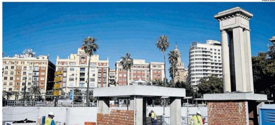
Obras en el puerto de Málaga para la instalación de las dos esculturas.

Se equivocó al pensar que con la gue que prestaría el apoyo militar y econó sario, conseguiría destruir la economí propia trampa, de la que ahora, desesp salir. ■