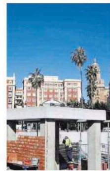
Trabajos de construcción de los soportes para las esculturas.

El texto señala también un principio preventivo establecido en el Decreto de 4/1993 de 26 de enero en que la Junta de Andalucía exige el control administrativo previo de cualquier actuación susceptible de afectar a bienes del patrimonio histórico andaluz. «No puede dejarse de sorprender el celo normativo que la Consejería de Cultura lleva a cabo con proyectos de edificación en el ámbito histórico de Málaga para asuntos de menor incidencia, y ante una afección del entorno urbano tan notable como la que pueden producir las estatuas no haya emitido ningún pronunciamiento público».