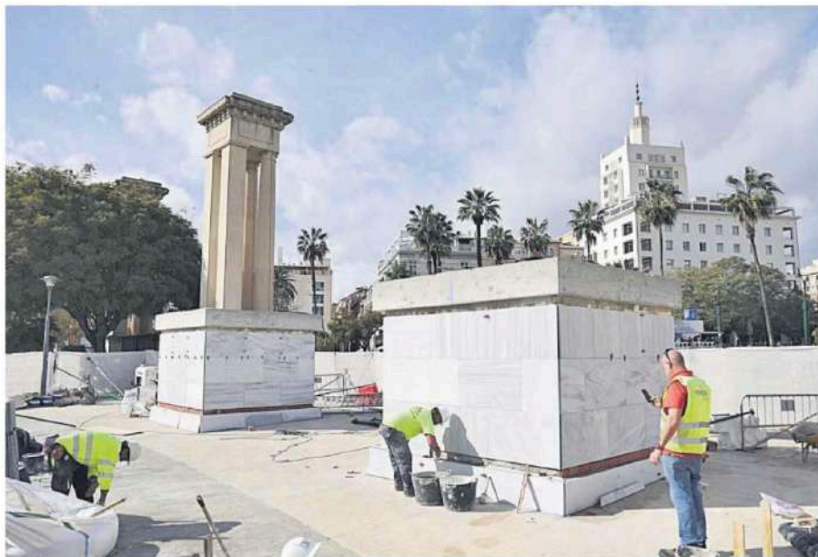
Trabajadores rematan los pedestales que soportarán las esculturas.

ley que rige el urbanismo en Andalucía, tampoco recoge como necesario este trámite, "ni siquiera una Declaración Responsable".