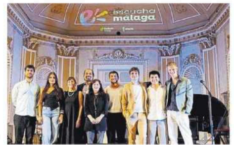
Los ganadores de la primera edición de Escucha Málaga.

Las bases de la convocatoria 2026 se pueden consultar en www.escucha.eu . Los aspirantes solo tendrán que enviar el modelo de