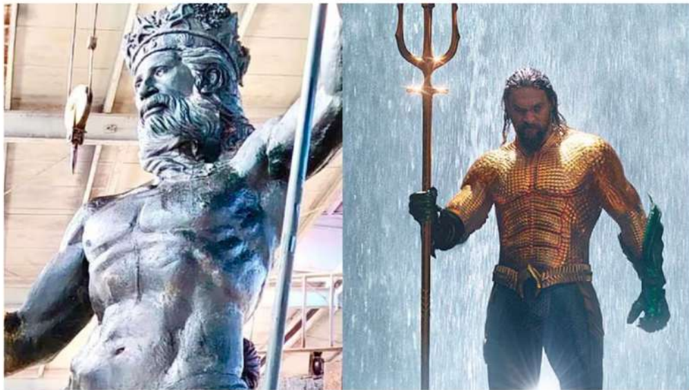
Las dos esculturas proyectadas para el puerto de Málaga

Un nuevo documento amplía la declaración institucional del 14 de enero y cuestiona la legalidad urbanística, patrimonial y administrativa de la iniciativa