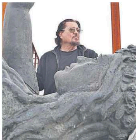
El escultor, delante de una obra.

Tras los seis meses a la entrada principal del Puerto por la Plaza de la Marina habrá que buscarle una nueva ubicación, siempre dentro de suelo portuario. "Será consensuada con el Ayuntamiento de Málaga", señaló, aunque desconoce cuál podría ser. Los