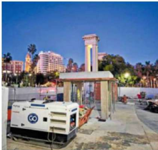
Estado de las obras en la actualidad. PEDRO J. QUERO

Este engendro portuario, cuyo basamento se está construyendo subrepticamente, debería ser inmediatamente paralizado por dos razones: una legal, pues no se trata de una obra con funciones estrictamente portuarias —de las que sólo el Puerto puede entender— sino con supuestos fines ornamentales, situada en pleno Centro Histórico, declarado Bien de Interés Cultural y cuya aprobación, por tanto, es competencia de la Consejería de Cultura y el Ayuntamiento de Málaga. Ambos tienen la obligación de entender procedimentalmente sobre la pertinencia de esta actuación y de garantizar el más elemental trámite de su pública difusión y conocimiento, que hasta ahora se ha hurtado, a menos que esto haya sido aprobado por la Gerencia de Urbanismo y la Comisión del Patrimonio y no se haya dado cuenta pública de ello. La Autoridad Portuaria, a desdicho de los inveterados hábitos de la institución,