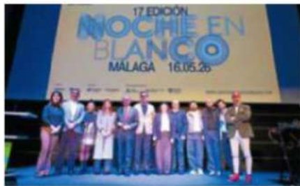
Foto de familia del alcalde con los diseñadores del cartel, junto con patrocinadores y administraciones implicadas.