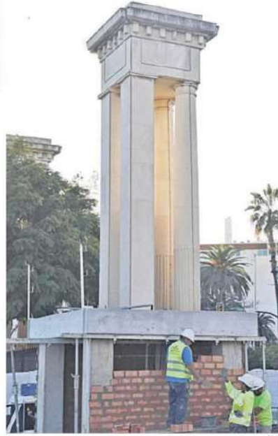
Los trabajos para levantar el pedestal.

A este respecto, a título personal, Peralta puso en cuestión "la provisionalidad": "Es dudosa. Cuando se colocan sobre el hormigón es muy difícil quitarlas. Como ciudadano no estoy dispuesto a soportarlo. Hemos celebrado la