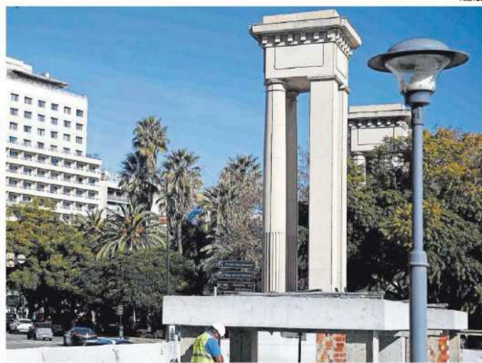
Imagen de archivo de los trabajos previos para la colocación de las esculturas en el Puerto de Málaga.

En este sentido, el dirigente del Puerto insistió en la legalidad de toda esta actuación y recordó que no es la primera exposición de ese tipo que se lleva a cabo: «La ley de Puertos del Estado nos habilita para hacer este tipo de actuaciones en el espacio portuario público; ya se han hecho antes otras exposiciones de esculturas o de marcos de acero».