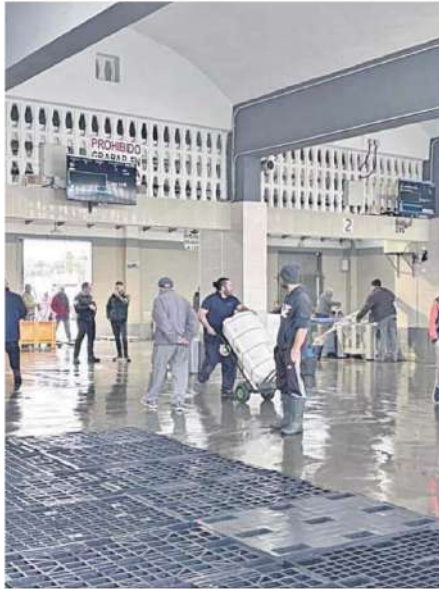
Imagen de la lonja de Caleta de Vélez