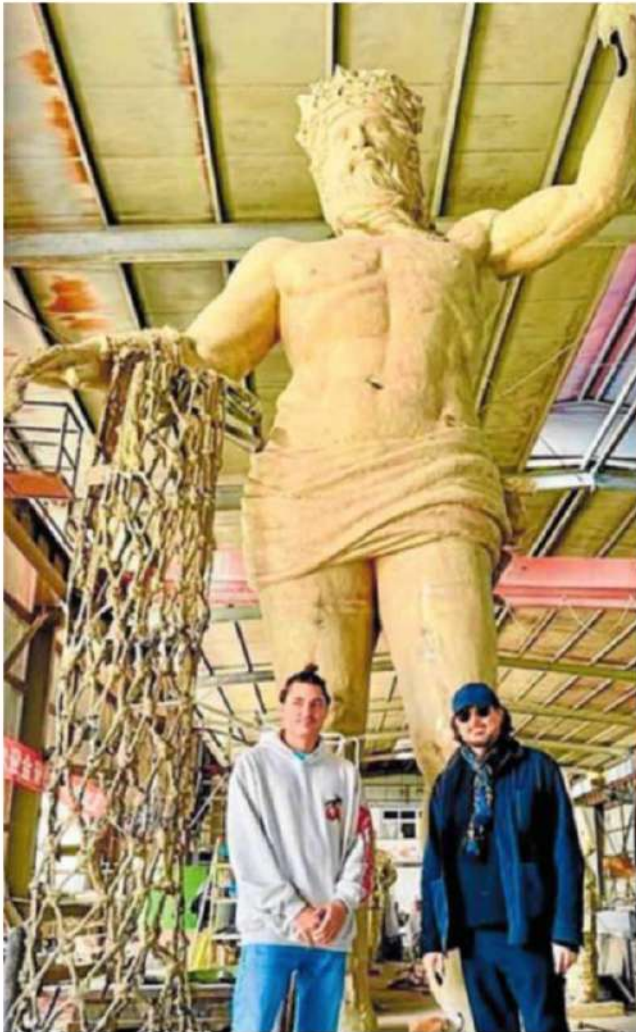
El artista junto a su hijo, ante la escultura de Neptuno. sus

Lamenta, además, el «menosprecio» que se hace a la trayectoria del artista, con una «importante carrera internacional y esculturas expuestas en muchas ciudades del mundo». «Merece un respeto», concluye.