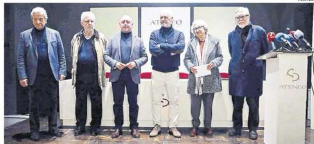
Representantes de las instituciones cívicas, ayer en el Ateneo de Málaga.

ras de bronce, una de 11 metros de altura, planeadas para el histórico puerto han sido criticadas por los ciudadanos y la academia de arte de la ciudad». Y se ilustra la información con una foto de la pieza del escultor, el ceutí Ginés Serrán, que comparte con otra del Aquaman de las películas protagonizadas por Jason Momoa. ■