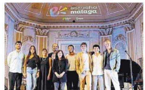
Los ganadores de la primera edición de Escucha Málaga.

Las bases de la convocatoria 2026 se pueden consultar en www.escucha.eu . Los aspirantes solo tendrán que enviar el modelo de