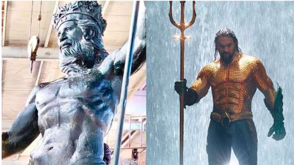
Las dos esculturas proyectadas para el puerto de Málaga

Un nuevo documento amplía la declaración institucional del 14 de enero y cuestiona la legalidad urbanística, patrimonial y administrativa de la iniciativa