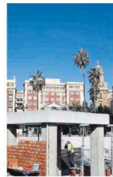
Trabajos de construcción de los soportes para las esculturas.