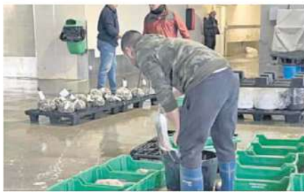
Un trabajador ordenando el pescado en la lonja

ro la gente que ha puesto esta modificación no es ni medio consciente del daño que puede hacer a los pescadores, a la gente que compra el pescado y a los que trabajamos en la lonja", mantiene.