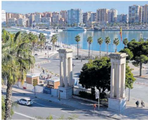
Entrada al puerto de Málaga, el lunes.