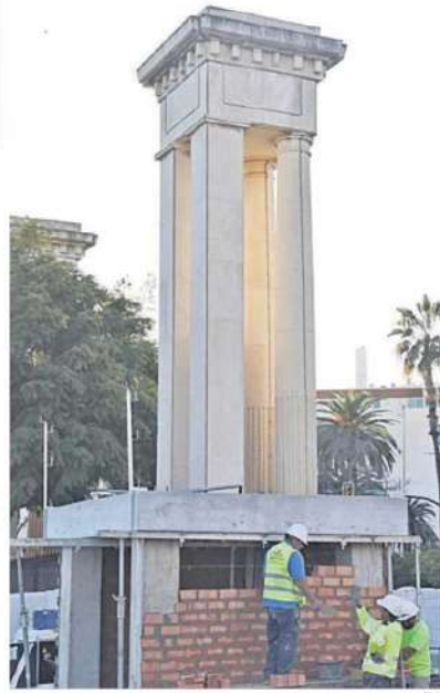
Los trabajos para levantar el pedestal.