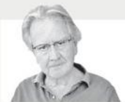
360 GRA JOAQUÍN

Zelenski se niega a iza blanca como le recom día el Papa Fran