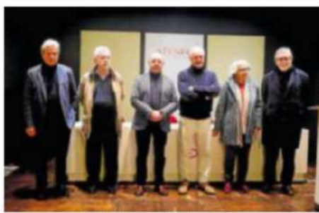
Representantes de las instituciones culturales, en el Ateneo. MARIÚ BÁEZ

Representantes de la Academia de Bellas Artes de San Telmo, el Ateneo de Málaga, la Academia Malagueña de Ciencias, el Instituto de Estudios Urbanos y Sociales y la Sociedad Económica de Amigos del País leyeron los seis puntos del manifiesto escrito para la recogida de firmas online en change.org, con 1.400 adhesiones hasta el momento. En ese escrito, critican el «tamaño colosal» y de una