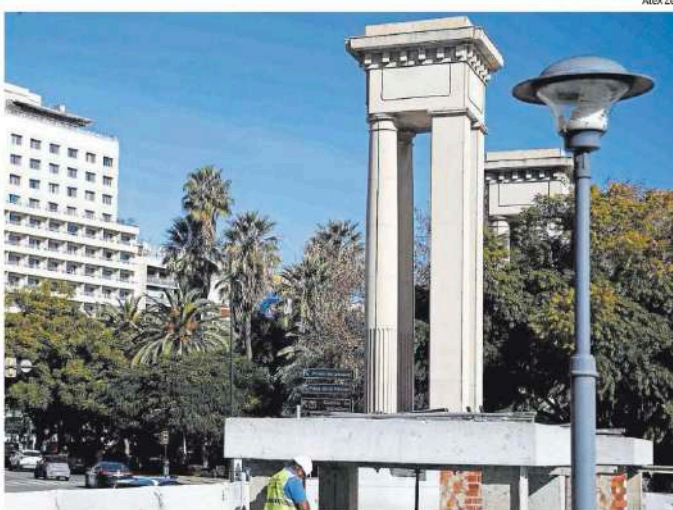
Imagen de archivo de los trabajos previos para la colocación de las esculturas en el Puerto de Málaga.

En este sentido, el dirigente del Puerto insistió en la legalidad de toda esta actuación y recordó que no es la primera exposición de ese tipo que se lleva a cabo: «La ley de Puertos del Estado nos habilita para hacer este tipo de actuaciones en el espacio portuario público; ya se han hecho antes otras exposiciones de esculturas o de marcos de acero».