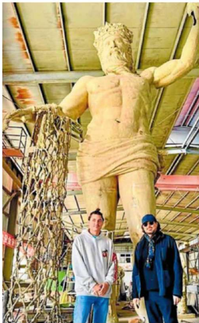
El artista junto a su hijo, ante la escultura de Neptuno. sur

Este antiguo brocal tallado en piedra blanca muestra las huellas del tiempo y de los vándalos, que han dejado su marca en forma de pintadas en esta pieza centenaria. Despierta nuestro interés el relieve con un cordero que está en la base de uno de sus ocho lados. Este animal es un símbolo religioso, el Cordero Místico, imagen del mismo Cristo según Juan el Bautista, que fue sacrificado por la salvación de la humanidad. El brocal sirve de macetero a un dragón, en cuyo tronco se aprecia la savia roja, la sangre del dragón. LA SOLUCIÓN, MAÑANA DOMINGO