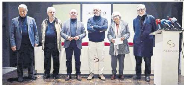
Representantes de las instituciones cívicas, ayer en el Ateneo de Málaga.

ras de bronce, una de 11 metros de altura, planeadas para el histórico puerto han sido criticadas por los ciudadanos y la academia de arte de la ciudad». Y se ilustra la información con una foto de la pieza del escultor, el ceutí Ginés Serrán, que compara con otra del Aquaman de las películas protagonizadas por Jason Momoa.