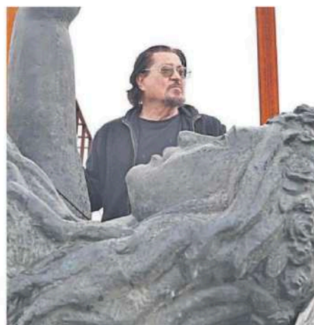
El escultor, delante de una obra.

Tras los seis meses a la entrada principal del Puerto por la Plaza de la Marina habrá que buscarle una nueva ubicación, siempre dentro de suelo portuario. "Será consensuada con el Ayuntamiento de Málaga", señaló, aunque desconoce cuál podría ser. Los