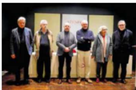
Representantes de las instituciones culturales, en el Ateneo.

Representantes de la Academia de Bellas Artes de San Telmo, el Ateneo de Málaga, la Academia Malagueña de Ciencias, el Instituto de Estudios Urbanos y Sociales y la Sociedad Económica de Amigos del País leyeron los seis puntos del manifiesto escrito para la recogida de firmas online en change.org, con 1.400 adhesiones hasta el momento. En ese escrito, critican el «tamaño colosal» y de una