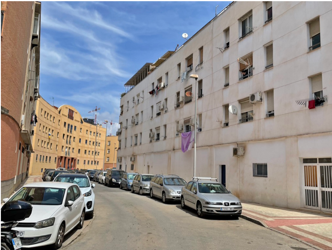
La Goleta.

En estos ámbitos, la desigualdad urbana no adopta necesariamente la forma clásica de periferia desfavorecida, sino la de centralidades frágiles sometidas a fuerte tensión de mercado .