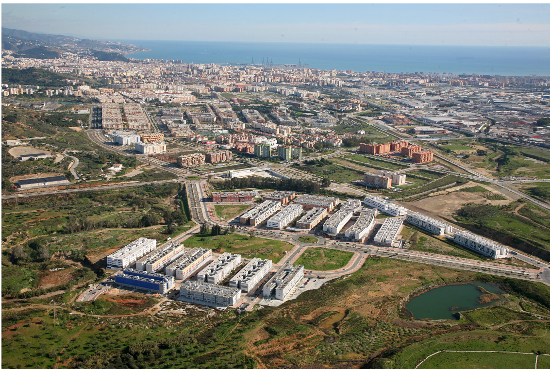
Soliva en la periferia de la ciudad.

Este dato es fundamental: la vulnerabilidad se expande territorialmente más allá de los enclaves históricamente estigmatizados . Lo que emerge es una geografía mucho más extensa de fragilidad urbana, que alcanza periferias mixtas, antiguos pueblos anexionados y ámbitos residenciales heterogéneos. La desigualdad deja así de tener un mapa compacto para convertirse en una constelación territorial amplia y estructural .