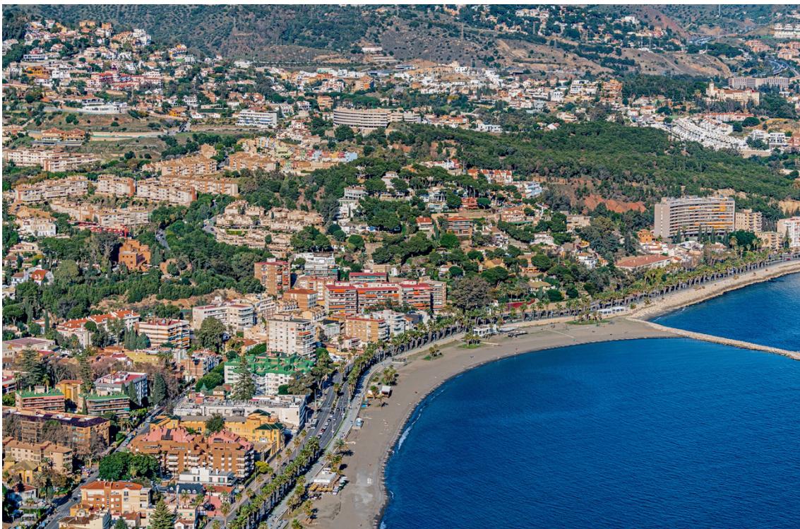
Parte del Litoral Este.

Desde este punto de vista, la ciudad no se transforma homogéneamente, se transforma selectivamente.