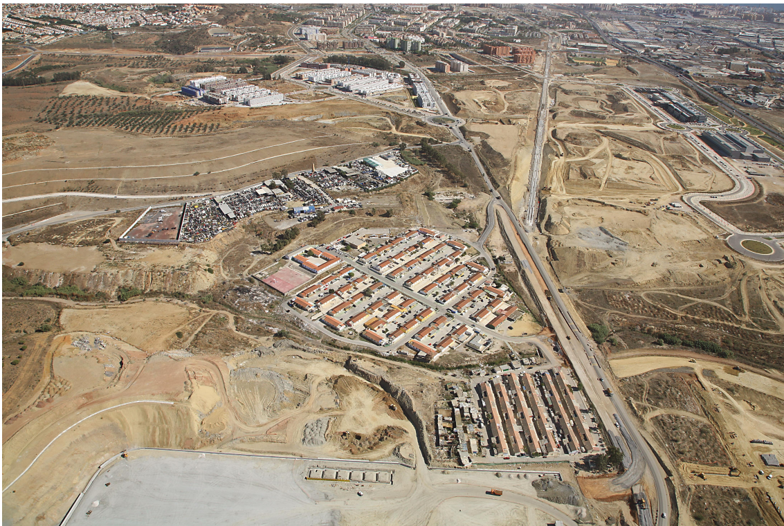
Los Asperones. Fuente: PMC 2009

De este modo, la vivienda deja de ser únicamente un soporte físico de residencia para convertirse en mecanismo de selección social y territorial , determinando quién puede permanecer en determinados barrios, quién debe desplazarse hacia áreas periféricas más asequibles y quién queda atrapado en situaciones de sobre-esfuerzo económico permanente.