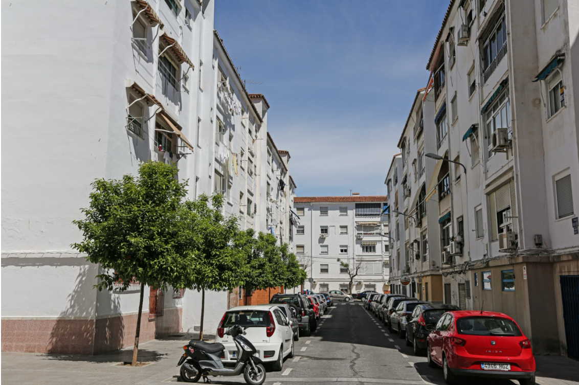
Barriada de Sixto.

Urbanísticamente, esto revela una paradoja histórica: los barrios que hicieron posible la expansión moderna de Málaga aparecen hoy entre los principales receptores de vulnerabilidad acumulada.