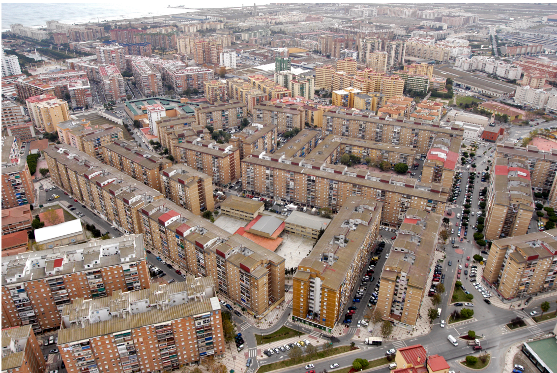
La Luz.

A esta vulnerabilidad heredada se suma hoy una presión contemporánea de enorme magnitud, el encarecimiento estructural del acceso a la vivienda.