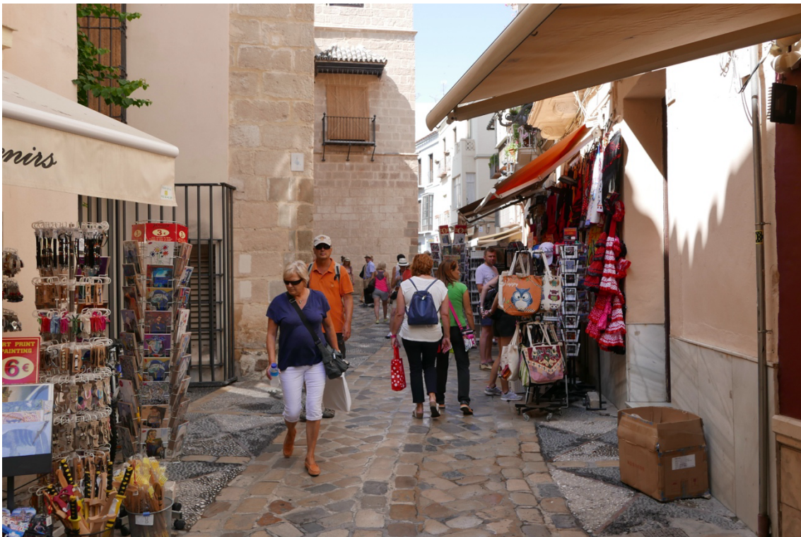
Aledaños del Museo Picasso.

La distancia entre ambos planos —el relato y la estructura social real— constituye una cuestión central de interpretación urbanística.